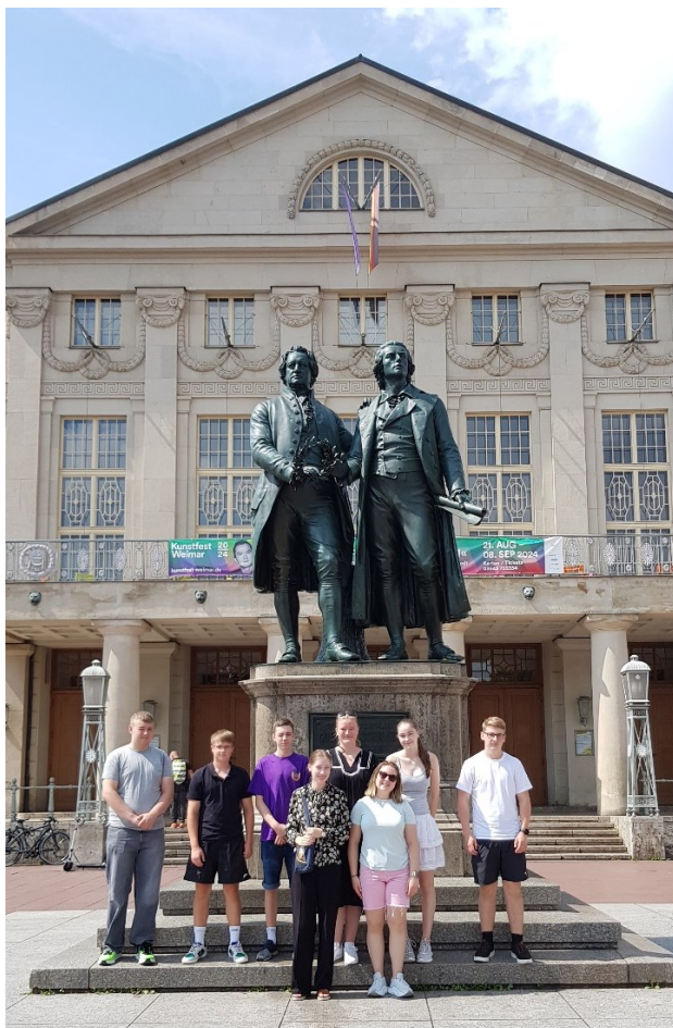
Statue av forfattarane Goethe og Schiller. Teateret i bakgrunnen.

viktig for Weimar, og byen har vore sentral i tysk politikk, til dømes ved at grunnloven for den første tyske republikken, Weimarrepublikken, vart vedteken her.