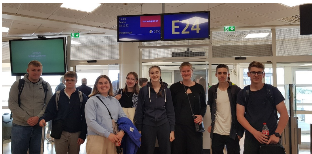
På Flesland – klare for avreise

28. juli reiste åtte flotte elevar til Erfurt . Dei har funne seg til rette på internatet og i byen. Elevane har lært å ta bybane, buss og tog og dei har vore fleire gongar på matbutikken for å proviantere. Det er veldig kjekt å sjå korleis dei tek ansvar for seg sjølv og for kvarandre!