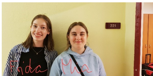
Elevane har fått rom på Internat 1 i Gispersleben.

Laurdag reiste vi til Weimar for å bli kjent med svært varierte kapittel i den tyske historia. Verdsberømte forfattarar som Johan Wolfgang von Goethe og Friedrich Schiller og komponisten Franz Liszt har budd og virka her. Teologen Martin Luther var sentral i byen og filosofar som Johan Gottfried von Herder og Friedrich Nietzsche har sett sitt preg på europeisk historie. Arkitektar med Walter Gropius sin skule for Bauhaus i føringa har vore