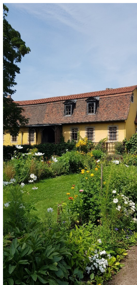
Goethe – hus og hage