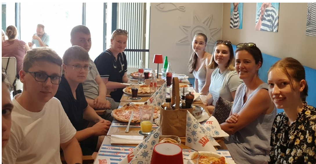
Pitstop i Weimar